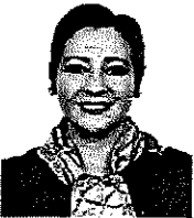
Dip. Fed. Angélica Reyes Ávila