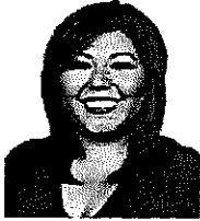
Dip. Fed. Genoveva Huerta Villegas